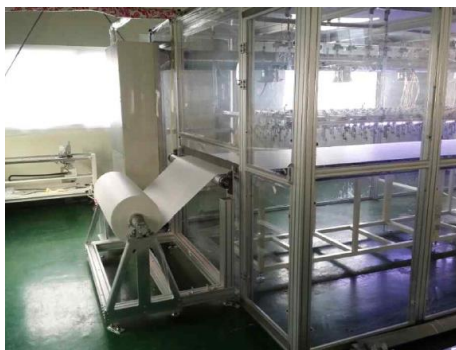
<나노섬유필터 자체 양산설비>